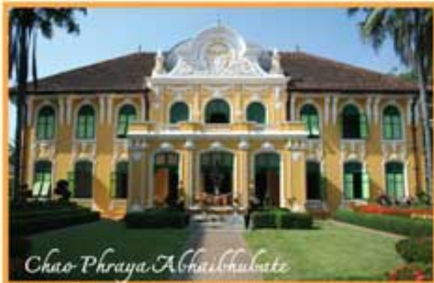
Chao Phraya Abhaiwittaya