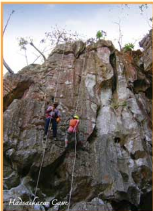
Hadsai New Cave