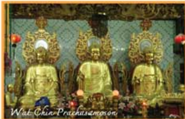
Wat Chin Prachasamoson